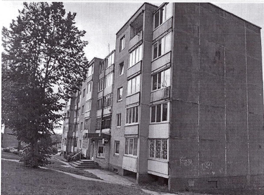
Pastato (jo dalies) fotonuotrauka

Pastatų energinio naudingumo sertifikavimo ekspertas